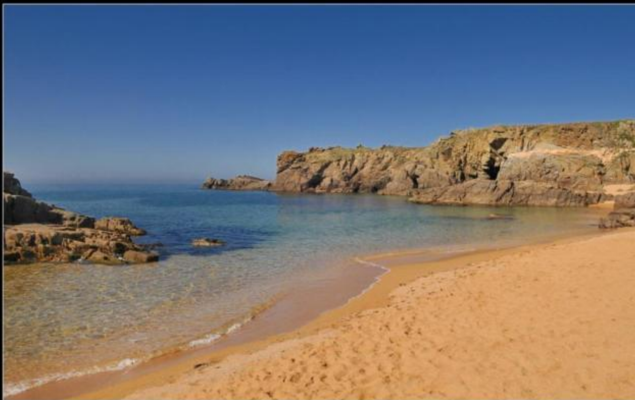
ÎLE D'YEU - Ker Doniau

L'île d'Yeu, c'est le dépaysement garanti