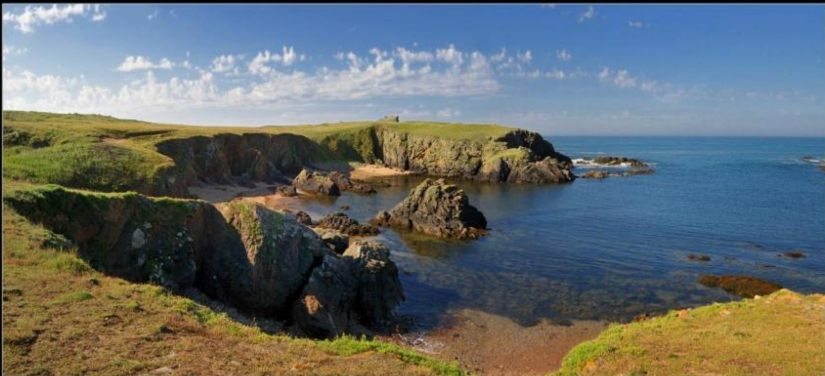
ÎLE D'YEU Anse des Fontaines