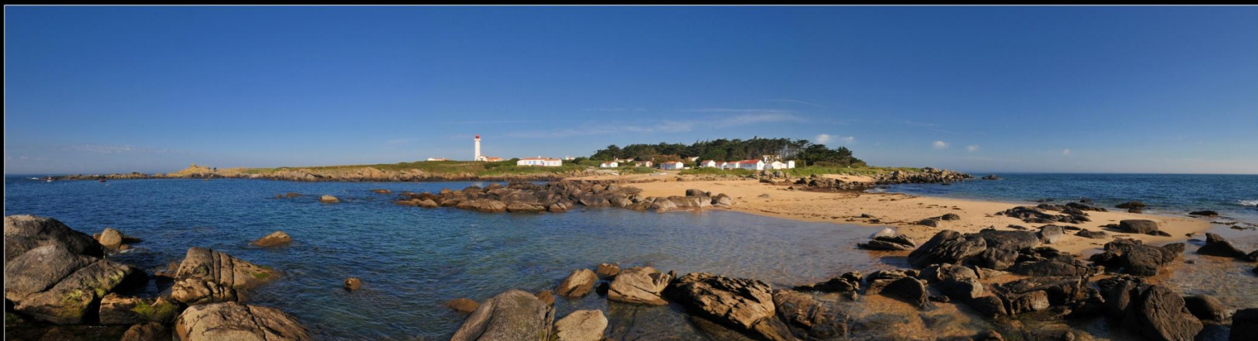
ÎLE D'YEU Pointe des Corbeaux