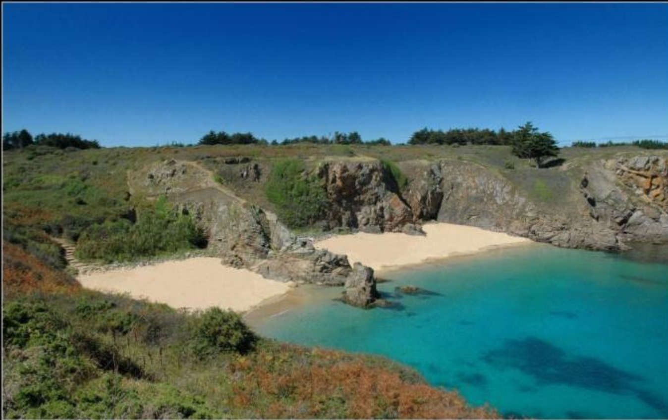
ÎLE D'YEU Anse des Soux