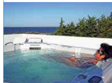
En photographie : magnifique paysage. Vue du village vacances. Coucher de soleil. Plage de la belle maison. Pointe du but. Spectacle professionnel. Catamaran. Une chambre ambiance marine. Le spa.